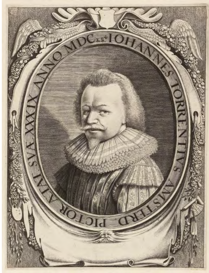
JOHANNES VAN DER BEECK "TORRENTIUS"