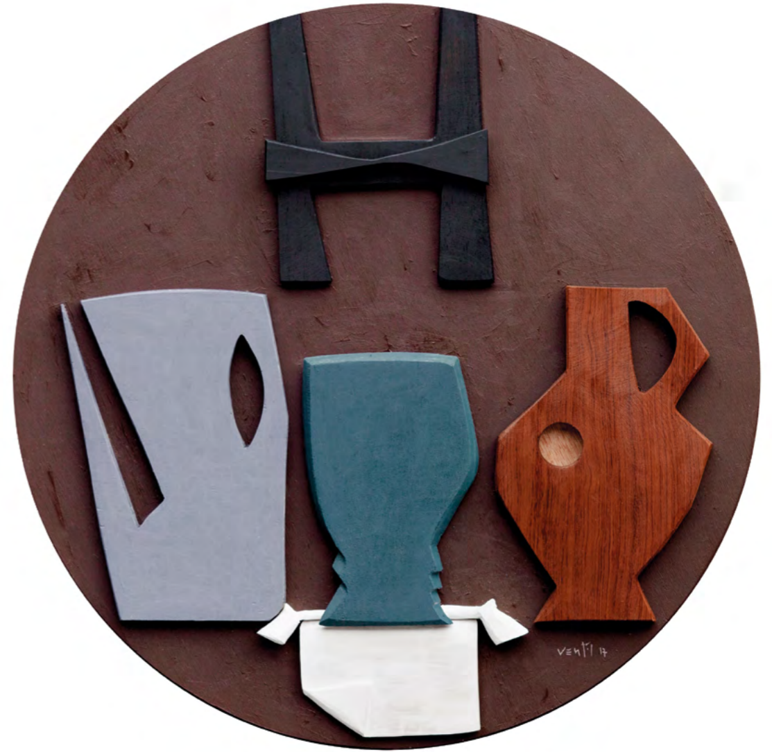
18 NATURALEZA MUERTA CON BRIDA Collage/óleo sobre madera 52 cm ø