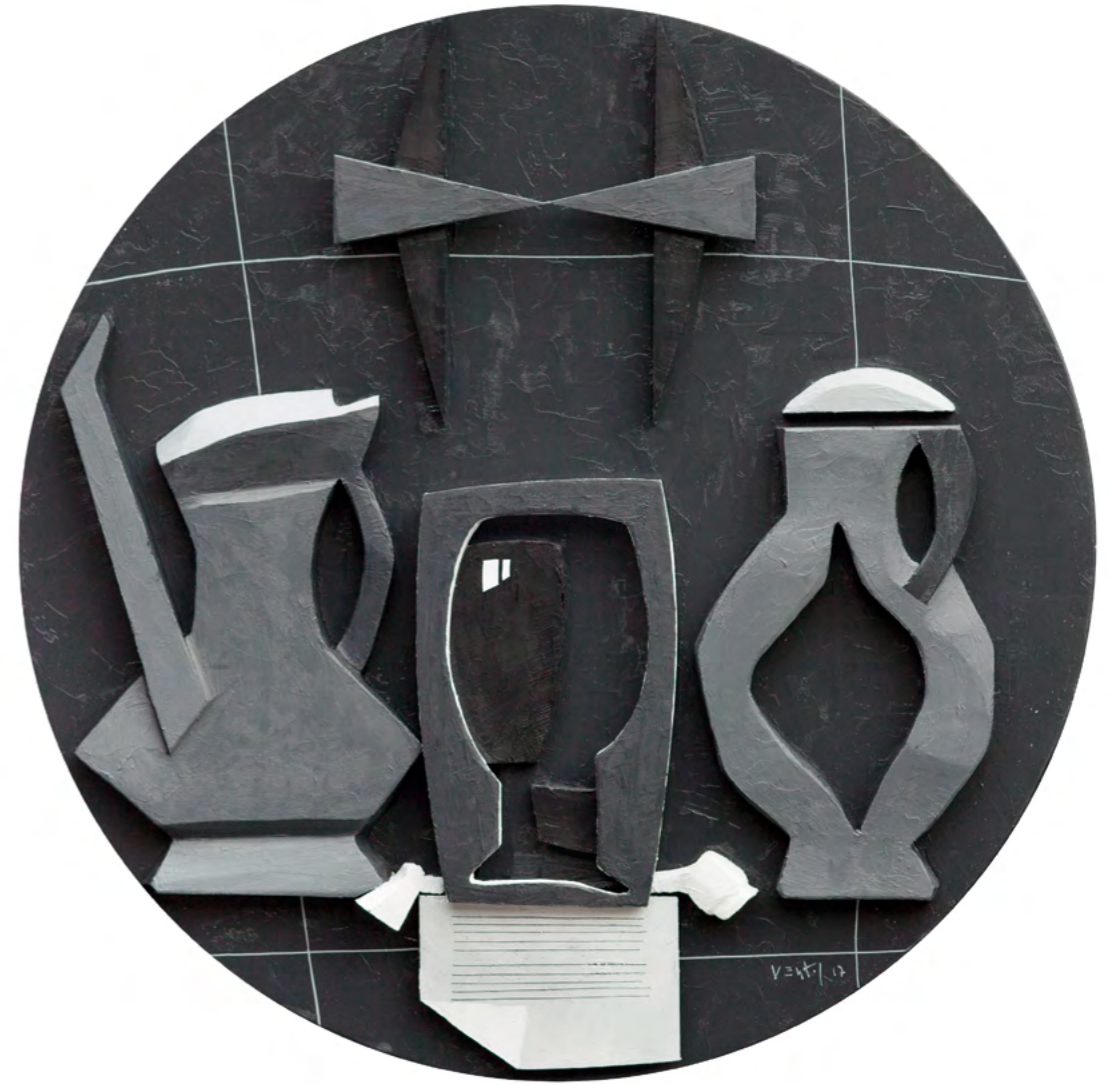
16 NATURALEZA MUERTA CON BRIDA Collage/óleo sobre madera 52 cm ø