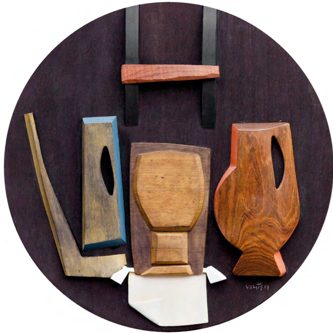
21 NATURALEZA MUERTA CON BRIDA Collage/madera 52 cm ø