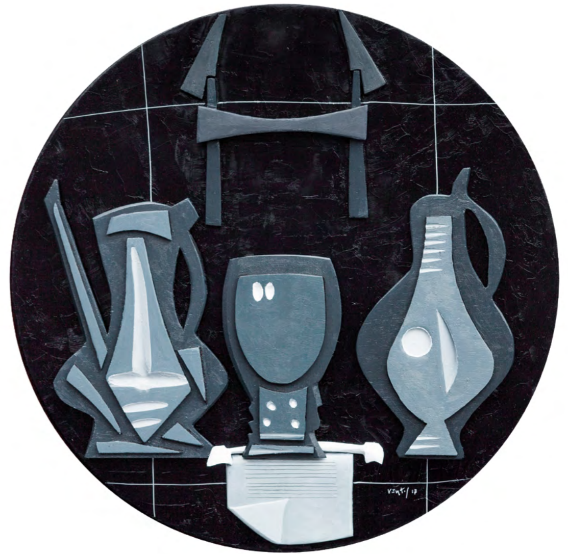
12 NATURALEZA MUERTA CON BRIDA Collage/óleo sobre madera 52 cm o