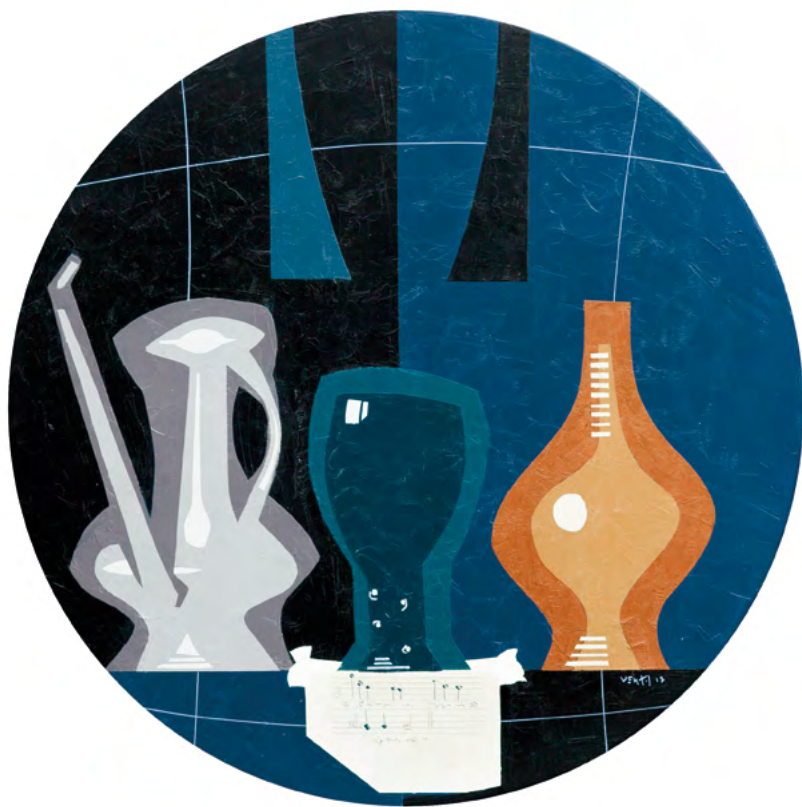
NATURALEZA MUERTA CON BRIDA Óleo sobre madera 52 cm ø