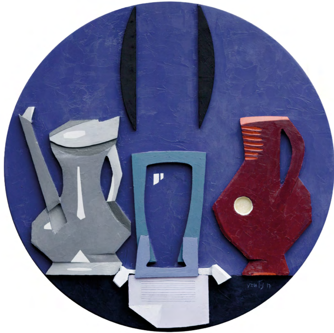
15 NATURALEZA MUERTA CON BRIDA Collage/óleo sobre madera 52 cm ø