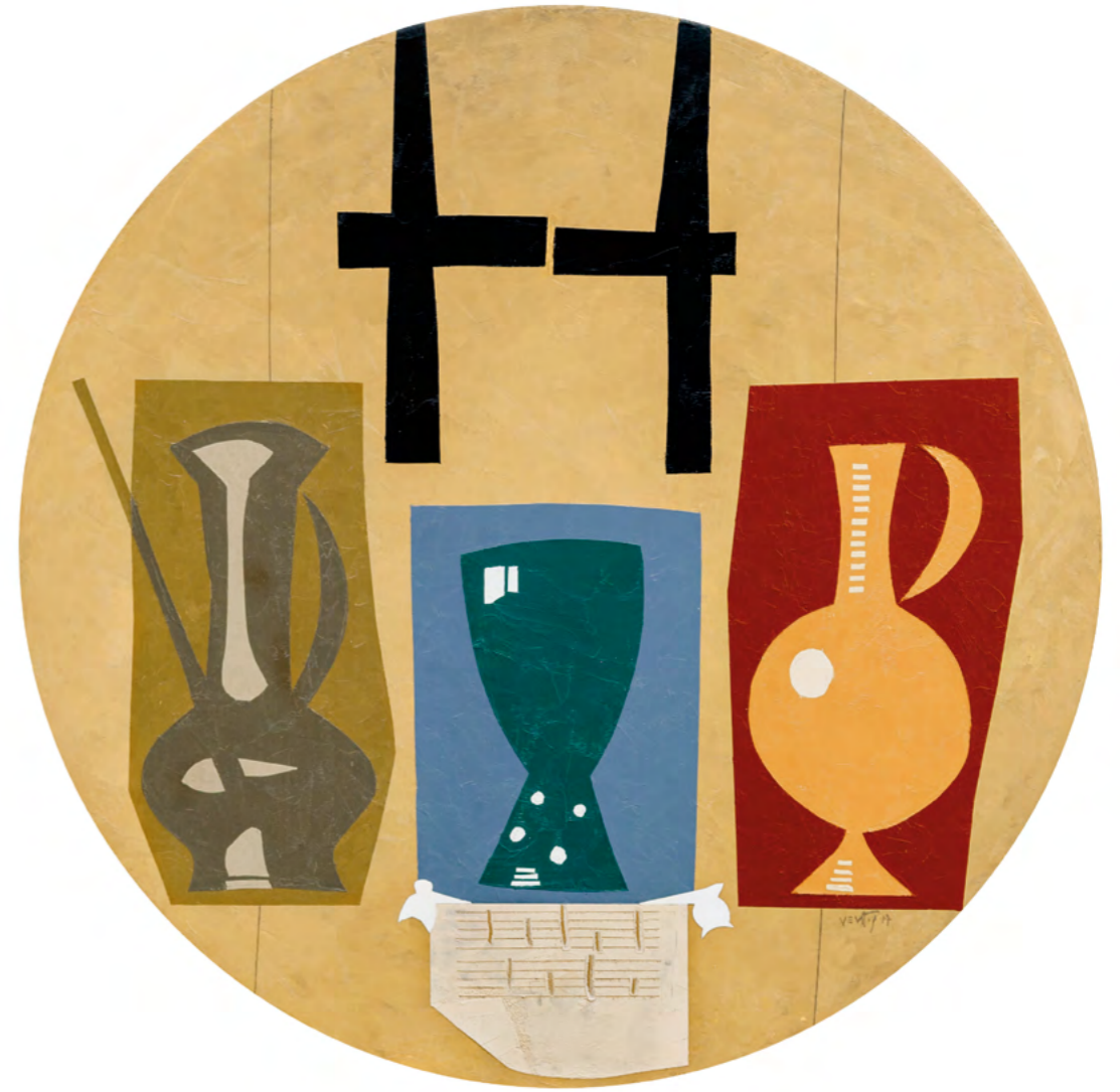
10 NATURALEZA MUERTA CON BRIDA Óleo sobre madera 52 cm ø