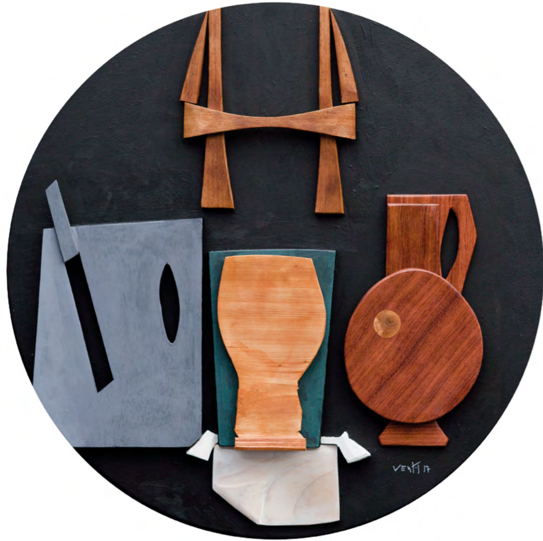
17 NATURALEZA MUERTA CON BRIDA Collage/óleo sobre madera 52 cm ø