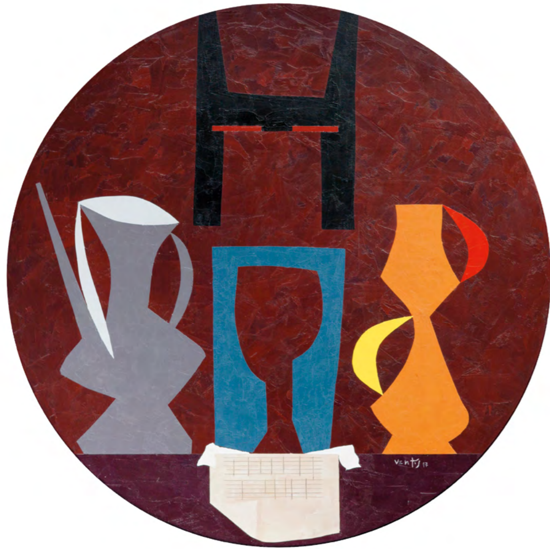
11 NATURALEZA MUERTA CON BRIDA Óleo sobre madera 52 cm o