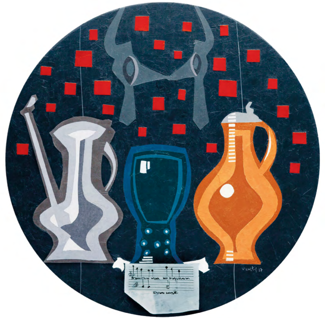
4 NATURALEZA MUERTA CON BRIDA Óleo sobre madera 52 cm ø