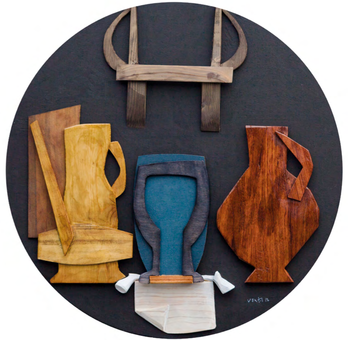
22 NATURALEZA MUERTA CON BRIDA Collage/madera 52 cm ø