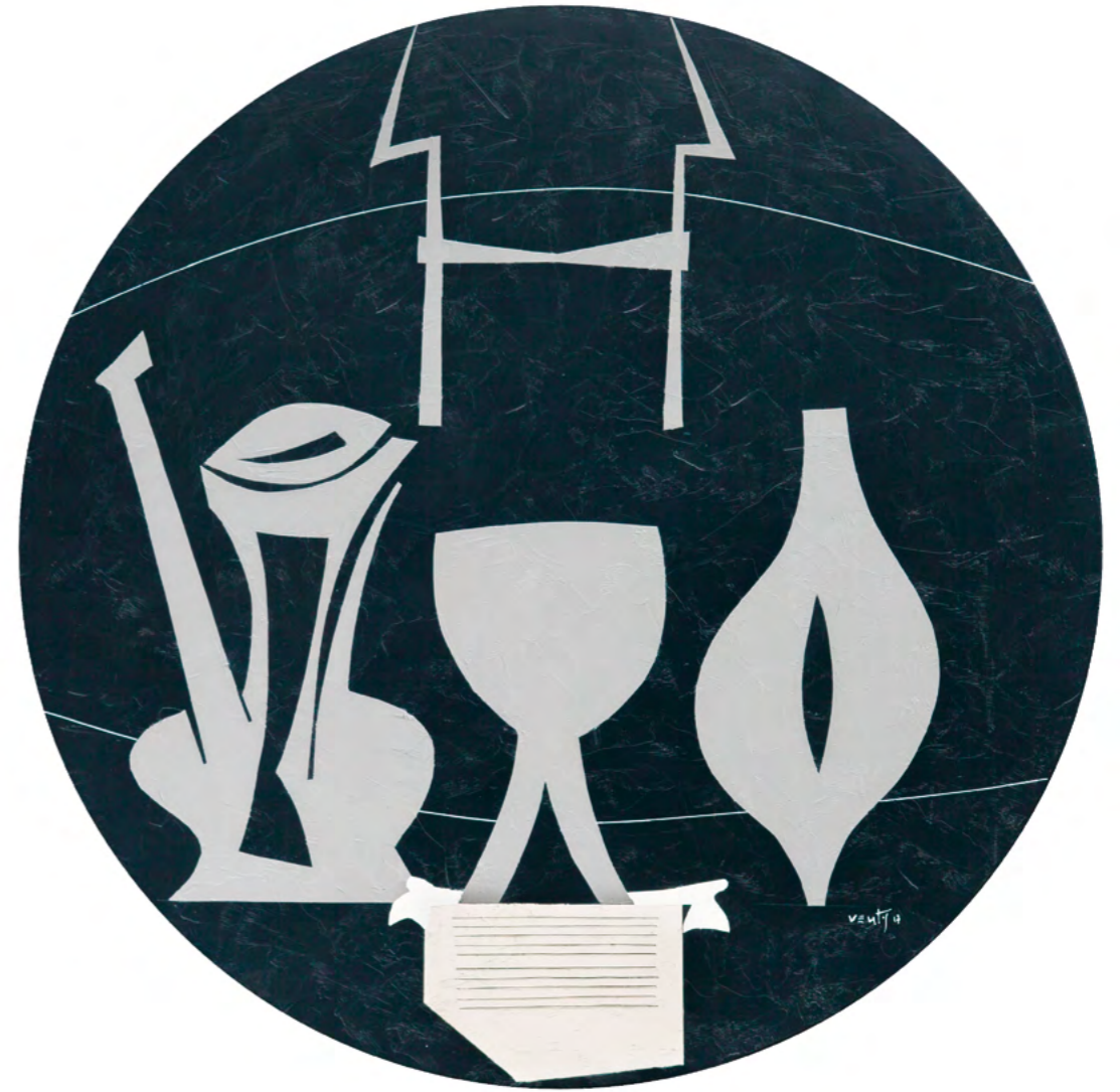
6 NATURALEZA MUERTA CON BRIDA Óleo sobre madera 52 cm ø