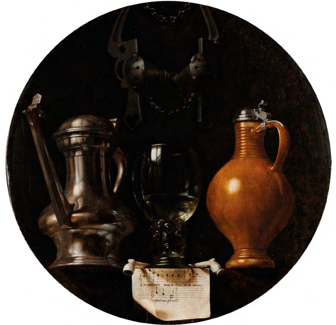
"NATURALEZA MUERTA CON BRIDA"