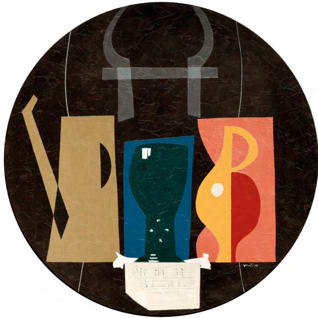
3 NATURALEZA MUERTA CON BRIDA Óleo sobre madera 52 cm ø