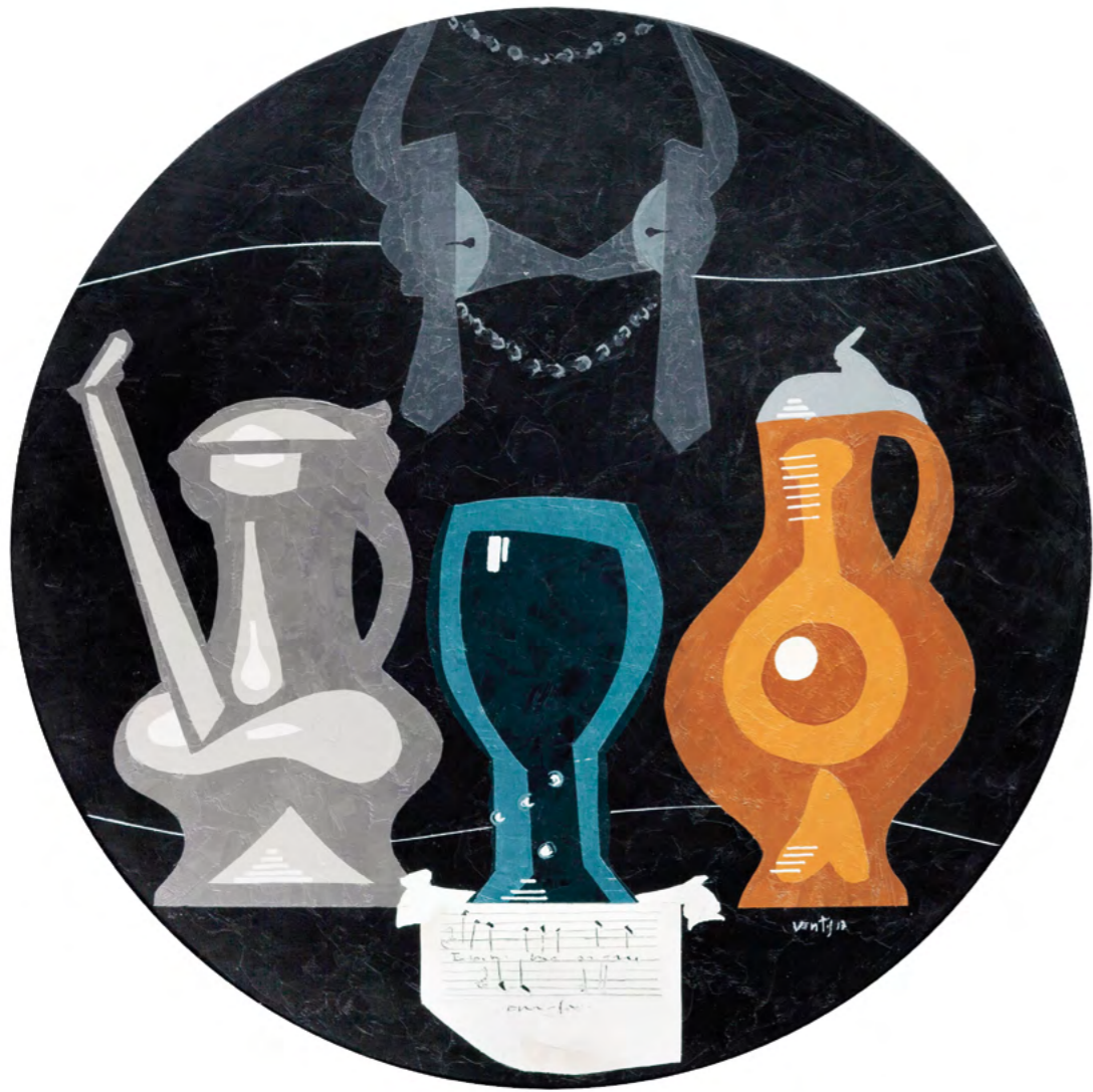
1 NATURALEZA MUERTA CON BRIDA Óleo sobre madera 52 cm ø