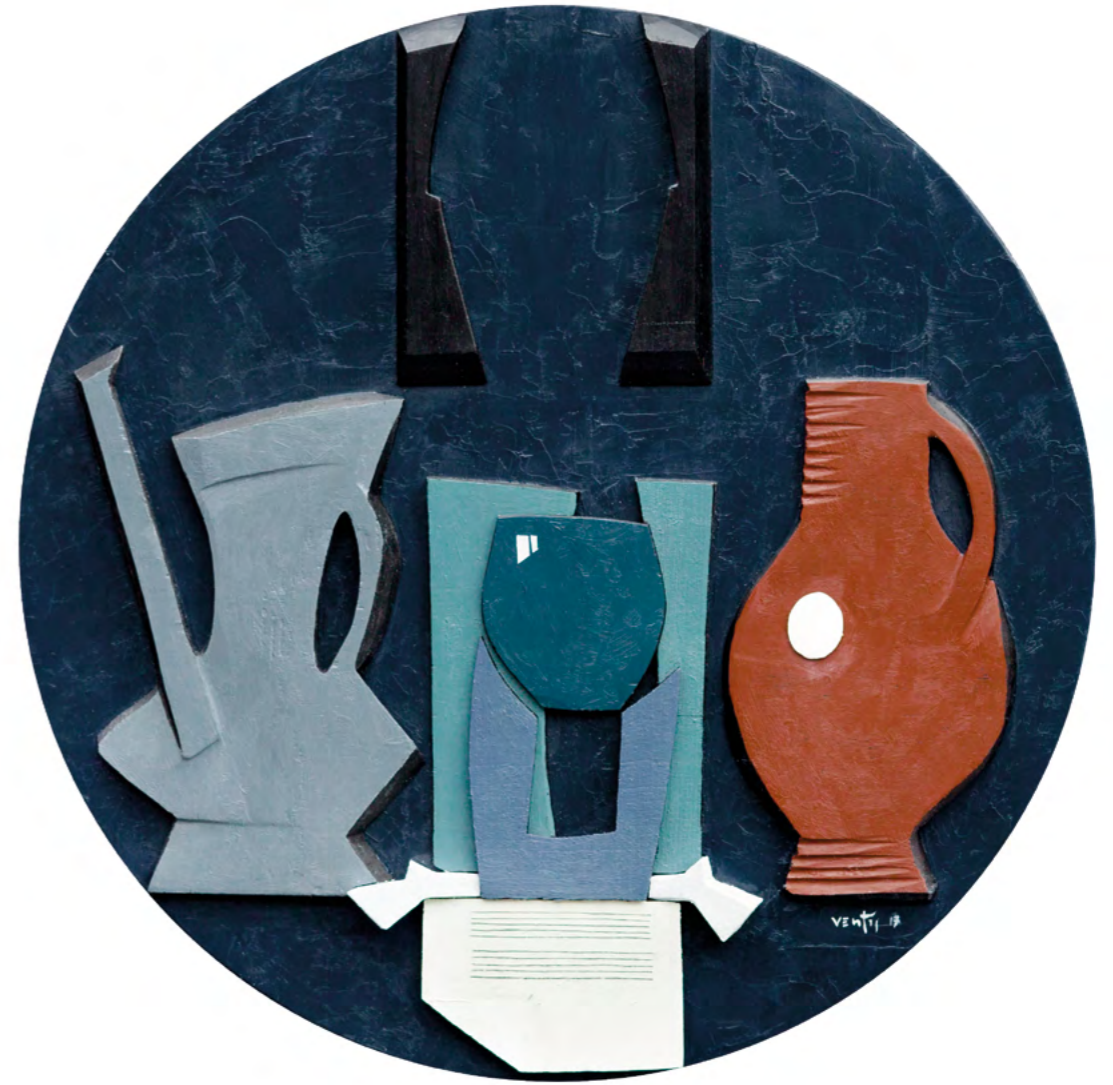
14 NATURALEZA MUERTA CON BRIDA Collage/óleo sobre madera 52 cm ø