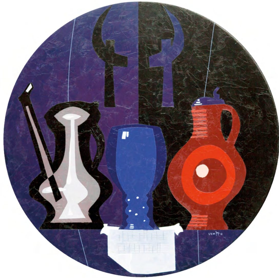
7 NATURALEZA MUERTA CON BRIDA Óleo sobre madera 52 cm ø