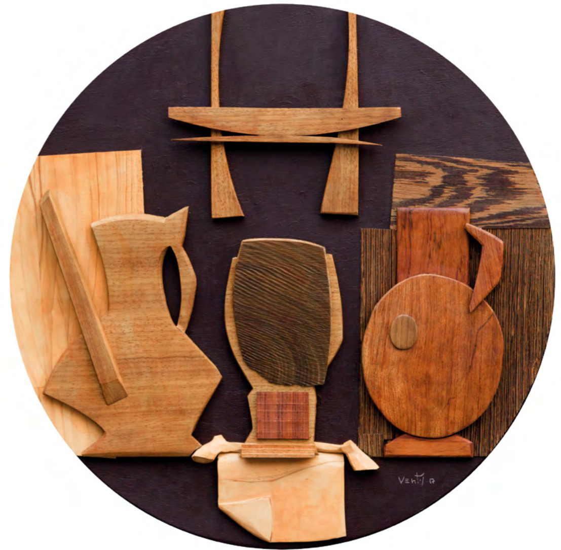
20 NATURALEZA MUERTA CON BRIDA Collage/madera 52 cm o