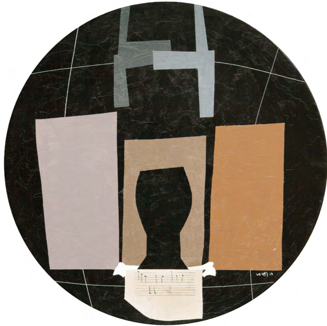
5 NATURALEZA MUERTA CON BRIDA Óleo sobre madera 52 cm ø