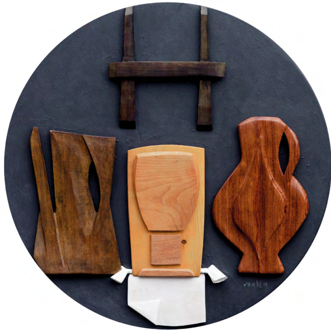
19 NATURALEZA MUERTA CON BRIDA Collage/óleo sobre madera 52 cm o