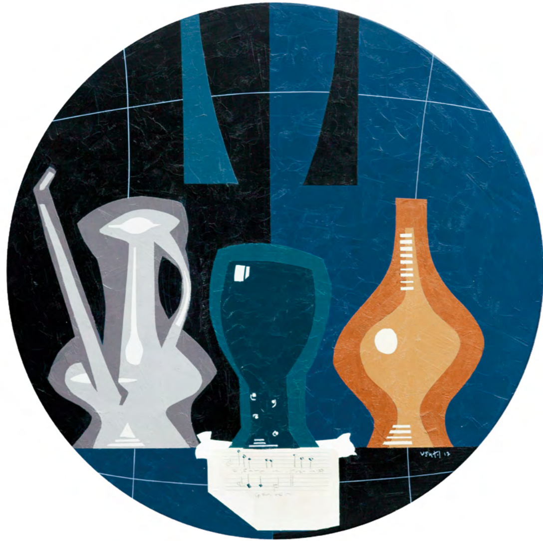
9 NATURALEZA MUERTA CON BRIDA Óleo sobre madera 52 cm ø